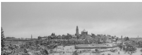
"Utakieni Yerusalemu amani; Na wafanikiwe wakupendao" Zaburi 122:6