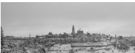
"Hoeraai Jerusalem thaayu; aria meendeete marogaacira" Thaburi 122:6